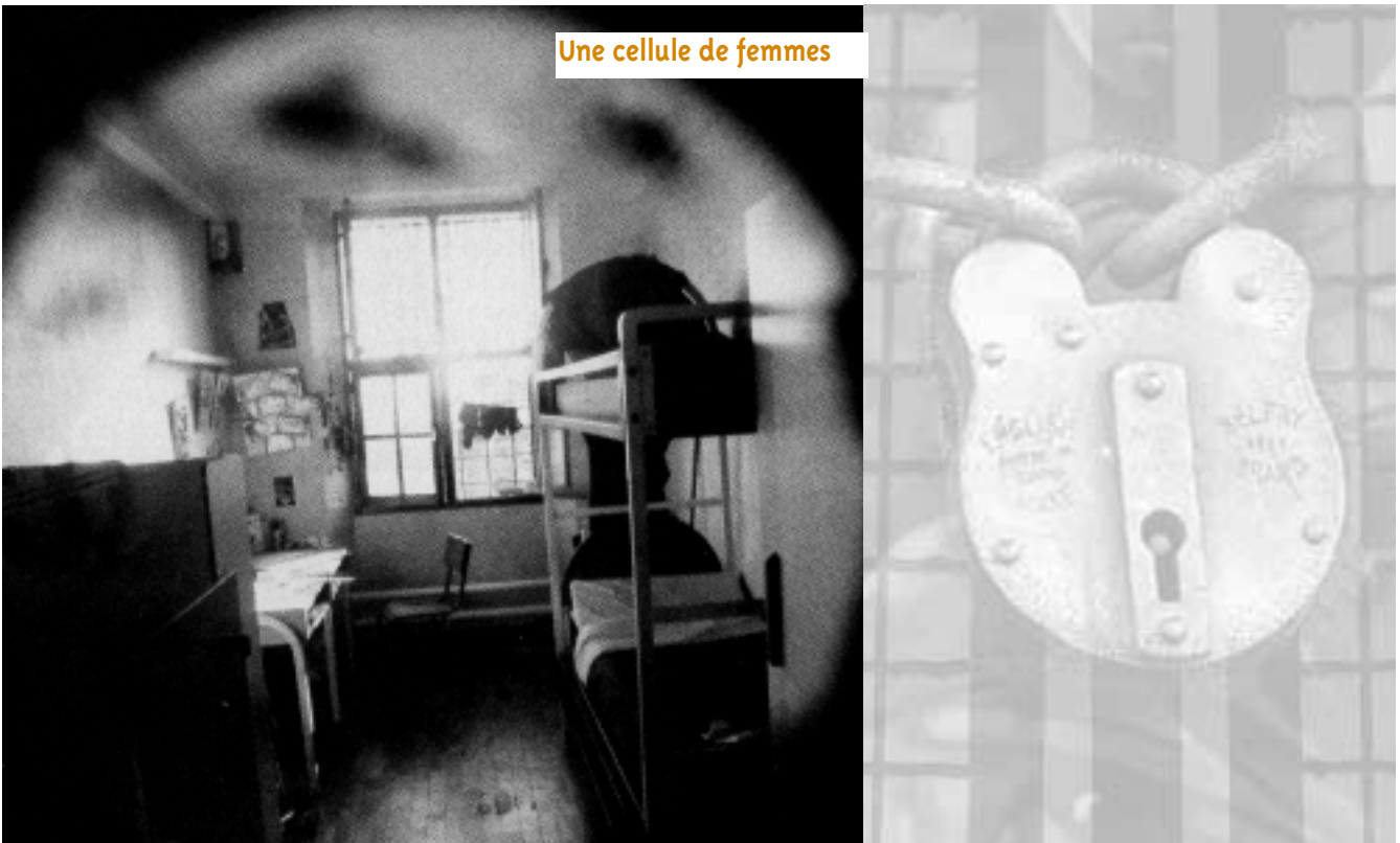
Une cellule de femmes